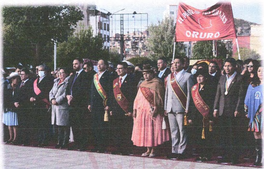
“Homenaje a los 242 años de la Revolución del 10 de febrero de 1781”