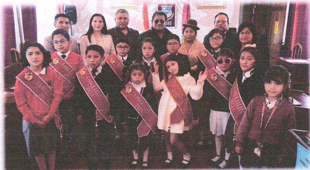
“Homenaje al 12 de abril Día del Niño”.