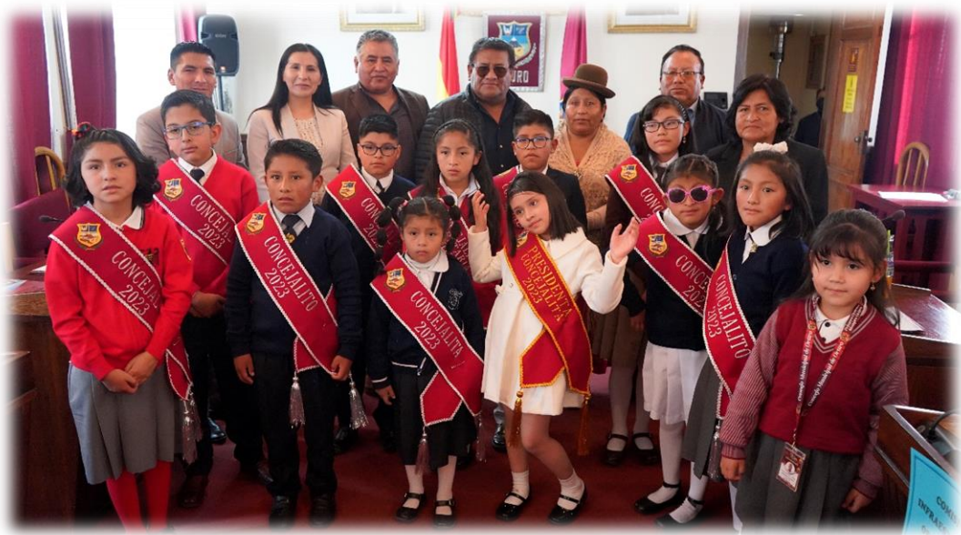
“Homenaje al 12 de abril Dia del Niño”.