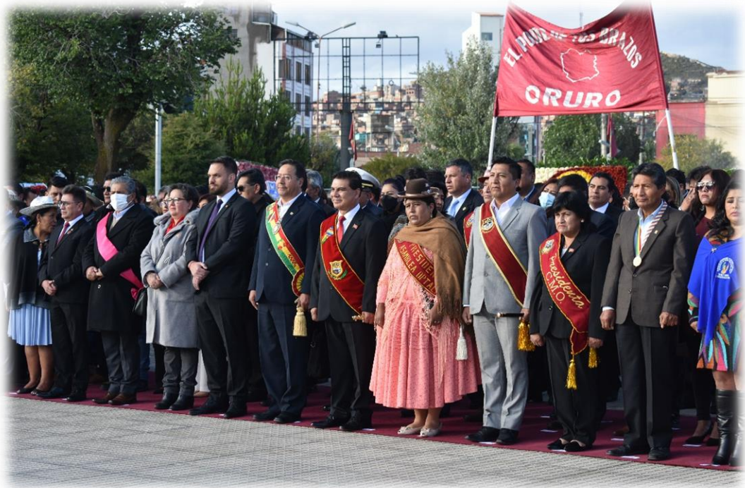
“Homenaje a los 242 años de la Revolución del 10 de febrero de 1781”